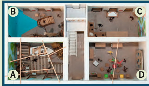
Modell des Grundriss